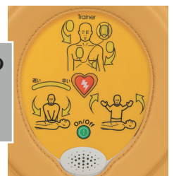
サマリタン PAD 450P [トレーナー]