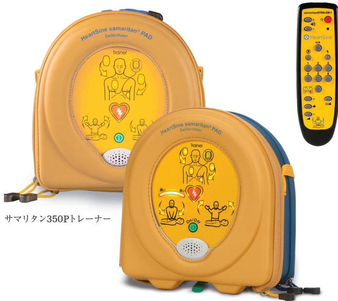
サマリタン350Pトレーナー