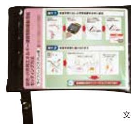
交換用小児用電極入り